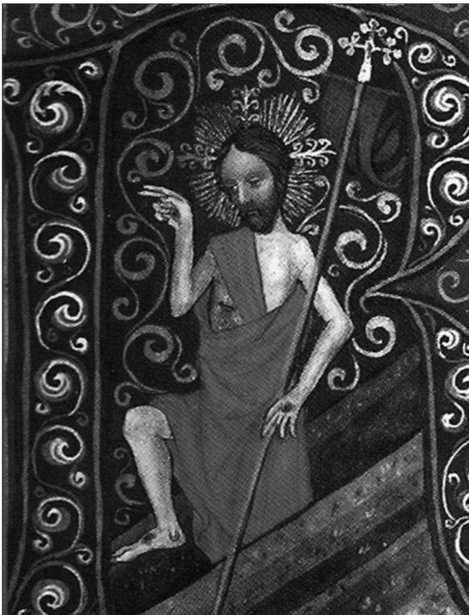
Iniciála "R" se zmrtvýchvstáním Krista (knihovna premonstrátů v Teplé, kolem roku 1460 s ikonografickým výkladem)