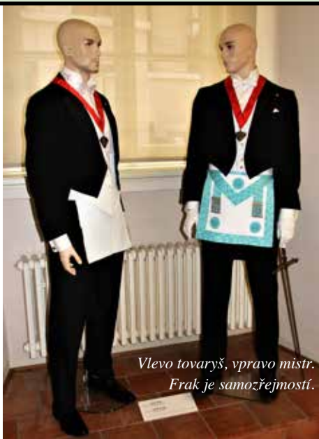
Vlevo tovaryš, vpravo mistr. Frak je samozřejmost.

Součástí tajemství, které svobodné zednáře obklopuje, je i záhadnost jejich původu. Na scénu dějin zednáři vstupují v roce 1717, kdy došlo ke spojení čtyř londýnských lóží do jediné velké lóže. Tento historický fakt sám však naznačuje, že ony