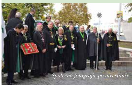
Společná fotografie po investituře