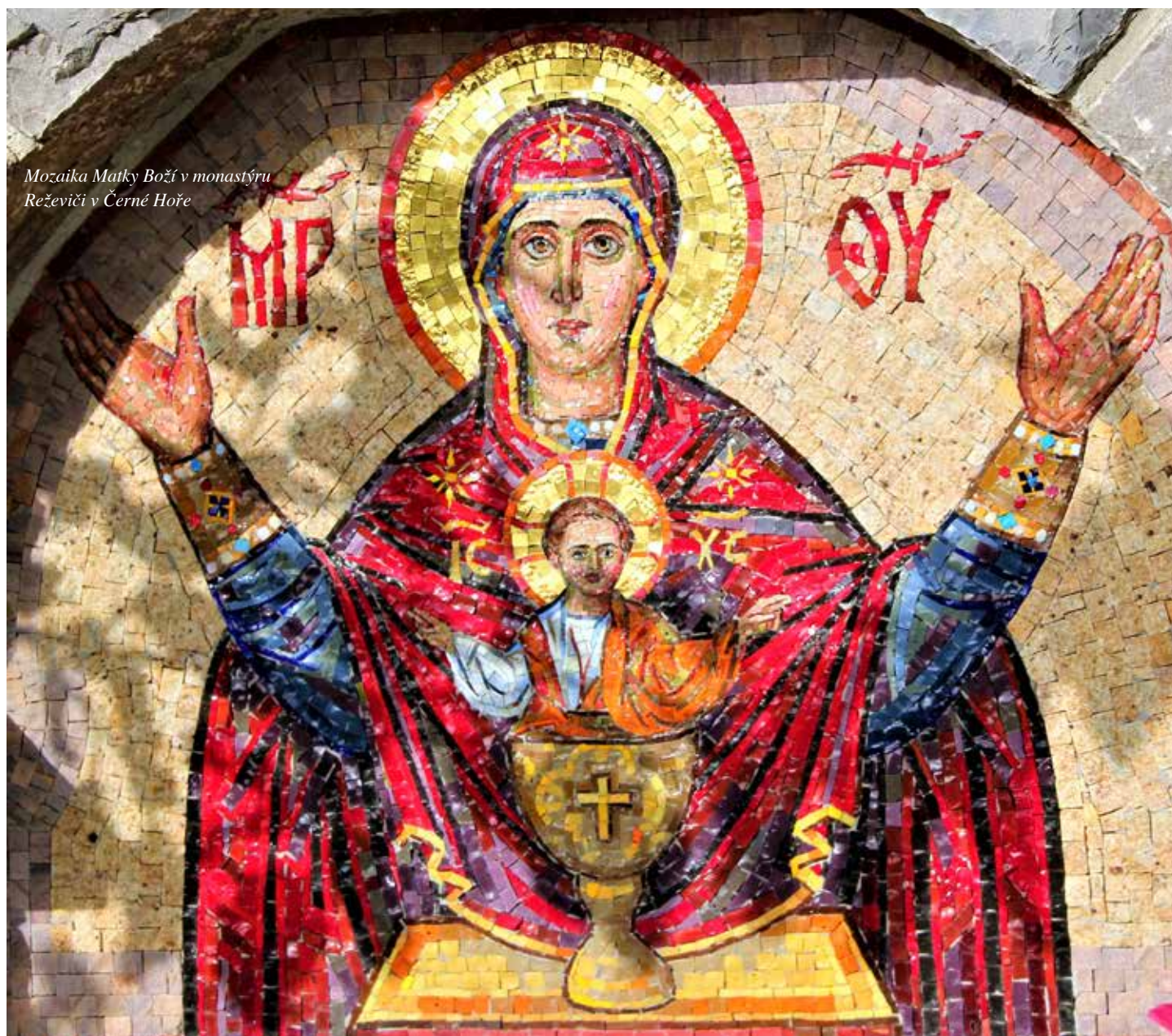
Mozaika Matky Boží v monastýru Reževiči v Černé Hoře

ČLENŮ VOJENSKÉHO A ŠPITÁLNÍHO ŘÁDU SV. LAZARA JERUZALÉMSKÉHO V ČESKÉ REPUBLICE ★ ★ ★ 4/2019