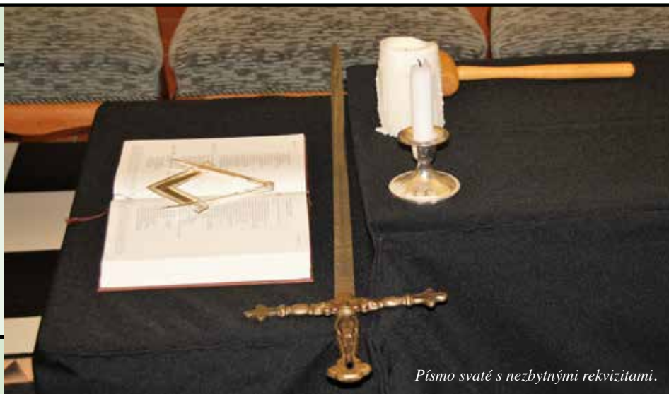
Písmo svaté s nezbytnými rekvizitami.

ryš – mistr, ve kterých pracuje většina lóží.