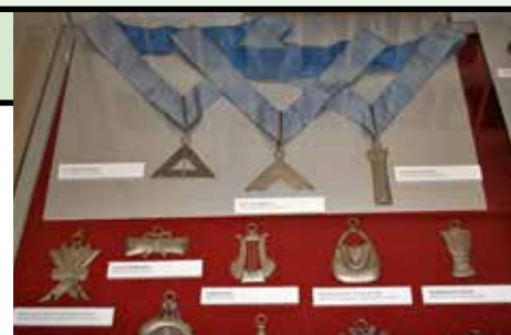
Ukázka zednářských dekorací.

Vladimír Němec (s citacemi z informačního letáku výstavy, foto autor)